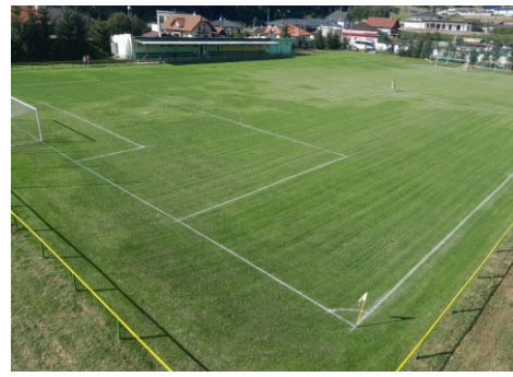
Trávnik po vzklíčení trávy

Sezónu 2023/2024 sme odohrali už na našom ihrisku.