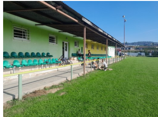
Zorganizovala sa brigáda, kde sa pomalovalo okolie ihriska, bránky, striedačky