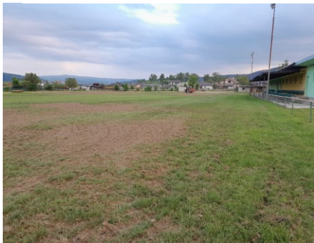
Trávnik pred zasiatím trávy