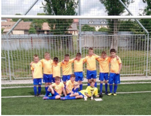
Mladší žiaci so svojím úspechom