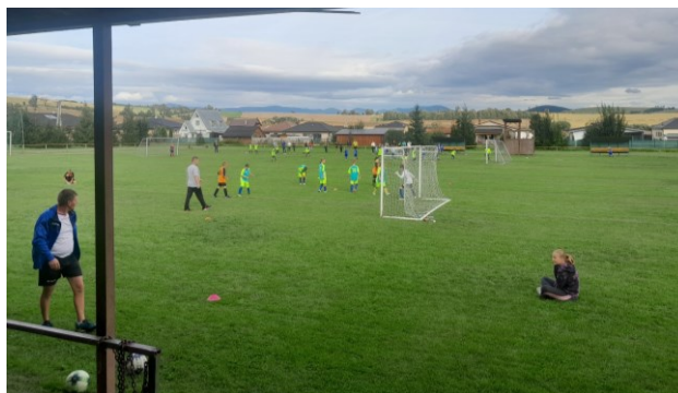
Turnaj mládežníckych družstiev

Tu by sme chceli osloviť každého, kto má záujem sa aktívne podieľať na futbale, či už z pozície hráča, sponzora alebo pomocníka je srdečne vítaný. Samozrejme, radi by sme boli, ak by tá aktivita prišla v prvom rade zo strany domácich detí alebo dospelých a privítame aj hráčov z okolia, ktorí nemajú možnosť aktívneho futbalu v obci. „Každému sú dvere klubu otvorené“